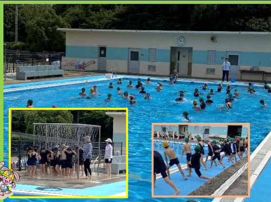
たんけん-ラビッツ

水遊び・水泳の授業が始まりました。久しぶりの水の感触を楽しむ子どもたちでした。しっかりと自分の目標をもって取り組んで欲しいと思います。