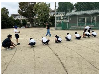
体育委員会コースづくり