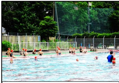
間隔をとって学習(2年)

1時間の授業で利用できるのは1学級だけということで、例年通りの授業時数をとることができませんことをご了承ください。