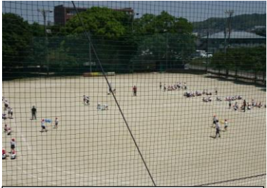
団体競技も楽しみです

5月の全校朝会で、子どもたちには、運動会へ向けて「全力を尽くす」と「集団行動を身につける」を心掛けてほしいと話しました。集団での活動の中で子どもたちが成長していくことは多く、そこに、学校全体で行う行事の意義があります。学級・学年の一員としての意識を強く持ち、みんながやり遂げる喜びを感じながら、本番では、存分