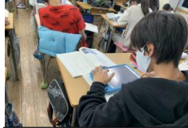
一人で読み取る 6年