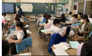
ペアで話し合う 4年