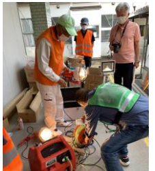
発電機の動作確認