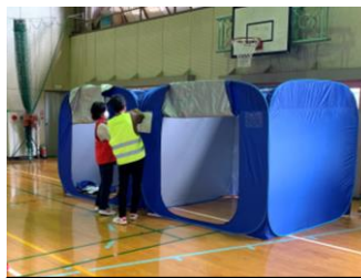
間仕切りテントの設営

学校側も、日ごろから地域の皆様としっかり連携していくことの大切さを強く感じました。