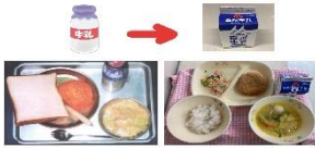
びんから紙バックへ