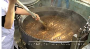
ちようりようちよう いんてい かーしーを つくります