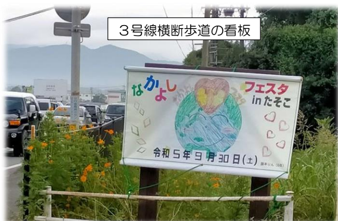
3号線横断歩道の看板