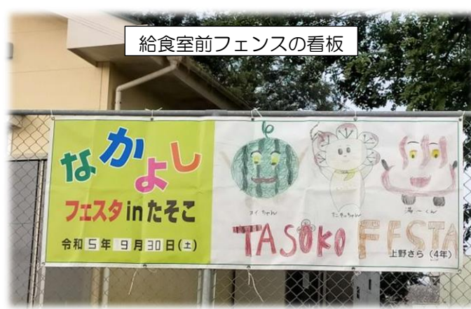
給食室前フェンスの看板

○6年生は 10:40～11:10 まで、「イベントふれあいタイム」に運営補助として参加します。PTAの方と一緒に各ブースで盛り上げていきます。ぜひ立ち寄って励ましてください。