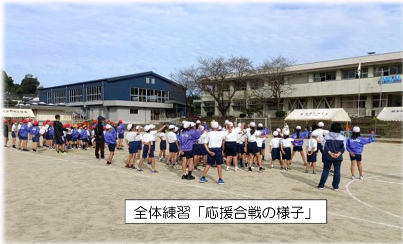
全体練習「応援合戦の様子」