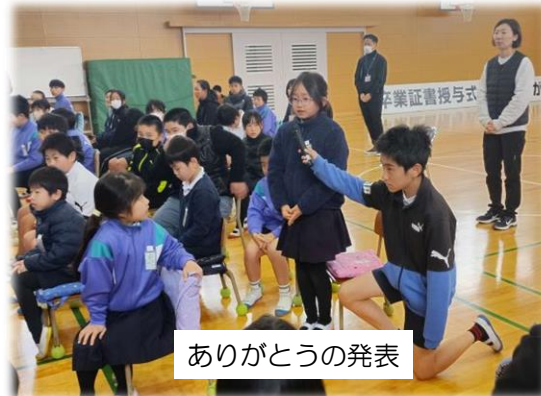
ありがとうの発表