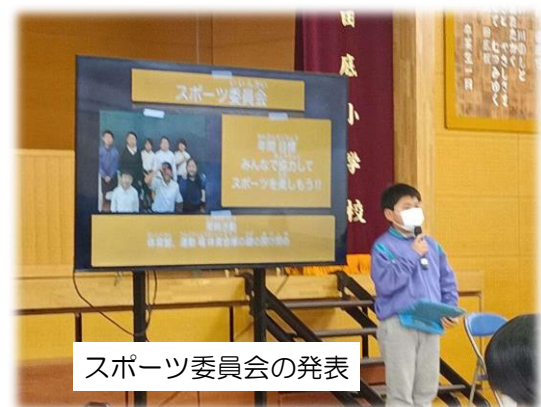
スポーツ委員会の発表

各委員会では、みんなが楽しく学校生活ができるためのイベントを行いました。（自治的活動）下表に紹介します。