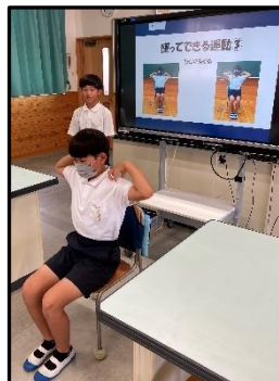
(体育委員会の龍西トレーニング)