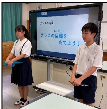
(司会の保健委員会)

3つの委員会の子どもたちの発表がとても素晴らしかったので、保護者の方々にも見ていただきたかったです。