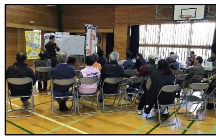
【「だし」について講話&試飲】