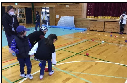
【スポーツ体験「ボッチャ」】