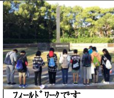
フィールドワークです 1日目フェリーの様子！