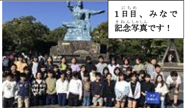
1日目、みなで記念写真です！