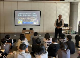
講話中真剣です！下は会場となった稲佐山の柵からの景色です

6年生の保護者の皆様、楽しみながら準備していく子どもたちに、ここしばらくずっとお付き合いいただいたのではないかと思います。おかげさまで皆元気に、皆で協力して素晴らしい修学旅行にすることができました。ありがとうございました。