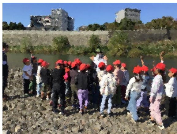
白川わくわくランド