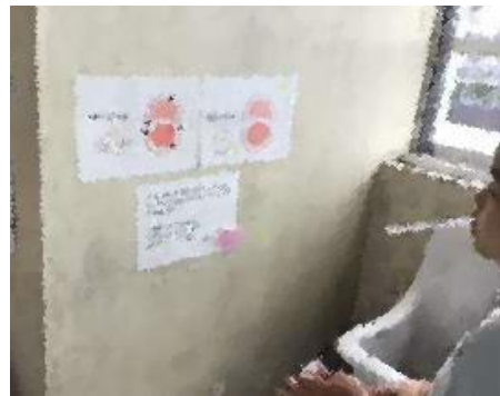
各学年の手洗い場にポスターも！

歯の健康について関心をもってほしいという思いを込めて、保健委員会の子供たちがポスターやクイズを各学年の手洗い場に掲示してくれています。