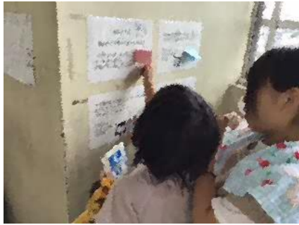
クイズの答えを考えている4年生