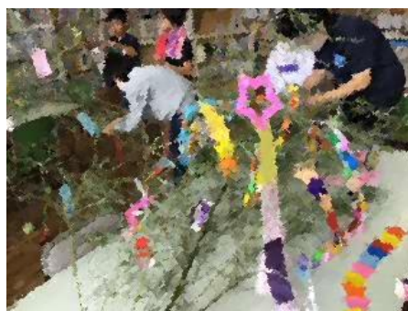
笹に願いごとを・・・♪