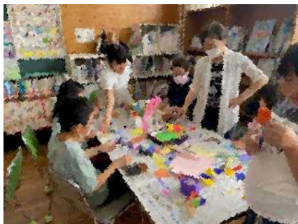
飾りづくりの様子