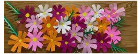
図書室前の掲示より(ミントの会作成)

子供たちが自分たちで企画し、楽しみながら実行しようとしています。まさに、学校教育目標の「自分たちで気づき、考え、行動できる子供」が育っていることに嬉しく思いました。