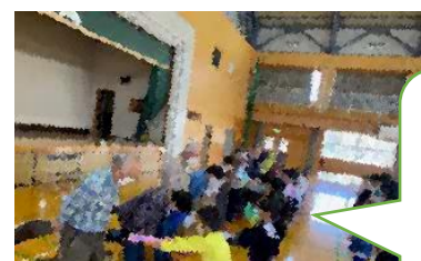
お礼もしっ かり伝え ました！