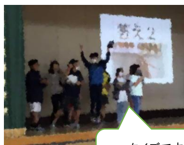
クイズです！ 正解したかな！