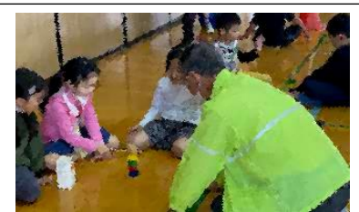
だるまおとしの様子

生活科の学習の中に「むかしあそび」があります。めんこ、だるまおとし、折り紙、あやとり、けん玉、おはじき等、地域の方々と一緒に遊ぶ活動を通して、遊び方を考えたり、支えてくださる地域の方々と楽しく交流することがねらいです。子供たちは地域の方々とのお話も楽しみながら、色々な遊びに取り組んでいました。4年ぶりの開催で、貴重な交流の時間となりました。