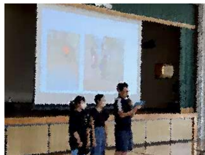
学校朝会で「生活目標」について説明