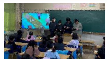
1年生の教室で読み聞かせをしている様子

1年生の教室をのぞいてみると、6年生が作成した「デジタル紙芝居」の読み聞かせがあっていました。ストーリーも絵も6年生が考え、タブレットを駆使して効果音や動きもついています。「1年生に楽しんでもらいたい」という気持ちから、数時間をかけて完成させたもので、「仲間を思うこと」や「あきらめないこと」などのテーマが入っていました。異学年の交流が温かい雰囲気も作ってくれています。6年生の高度な技術にも感動しました！