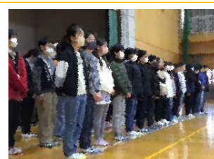
各学年へメッセージ。しっとりと歌う合唱を聴き涙を流す1年生の姿も！