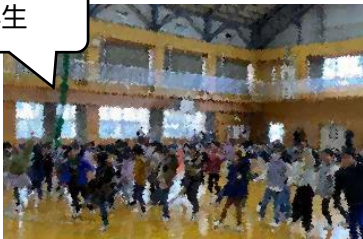
ジャンボリミッキーの歌とダンス！