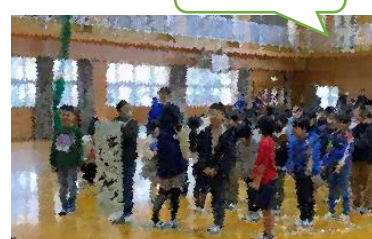
6年生に「挑戦状！」3年生は負けていません