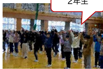
YASOBI の「ツバメ」歌とダンス！