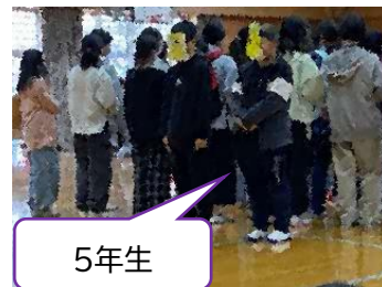
熱の入ったダンス♪に圧倒されました！