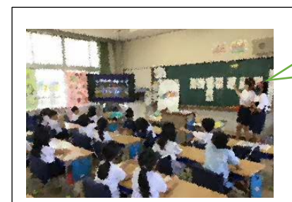
朝自習を活用して、各クラスに応援の手拍子練習を行っている応援団の5、6年生