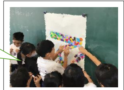
全校児童で決めた運動会スローガン中の一文字を学級で仕上げている3年生