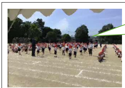
初めての全体練習で、場所の確認を一生懸命している1年生の様子