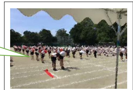
礼の仕方のお手本を見せてくれている6年生