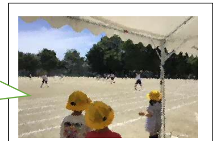
昼休みの様子…1年生にとって、5、6年生の応援団は憧れの存在になっています！