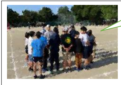
始業前から打ち合わせをしている体育委員会の5、6年生

子どもたちに対するご家庭での言葉かけは絶大なパワーの源だと思っています。子どもたち一人一人に応じた励ましや褒めの言葉をどうぞよろしくお願いいたします。