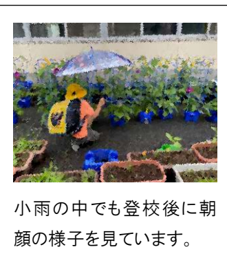
小雨の中でも登校後に朝顔の様子を見ています。

2年生のミニトマトも実をつけ始めました。一時期、暑さで弱っていましたが、子どもたちが一生懸命お世話をし、復活しています。自分でお世話をした植物の成長を感じる心は、優しさや思いやり、命を大切にしている心につながっていると思います。