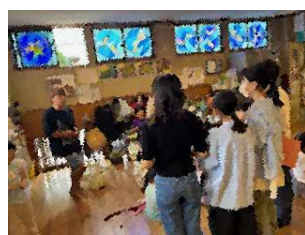
やまなみこども園での取材の様子