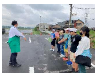
マルミヤストアでの取材の様子