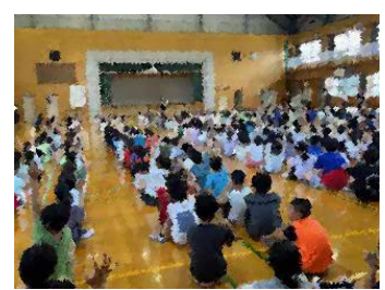
安全確認で体育館に集合している様子

不審者が侵入してきた場合は、まずは職員が対応していくことになります。その対応については、この日の放課後に職員全員で対策についての打ち合わせを行いました。みんなの安全を守るため、いざという時にどう連携をするかを色々な想定を考えながら行っています。