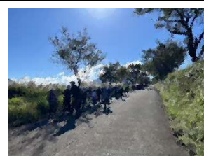
2日目の鷲見平登山 晴天に恵まれました～