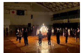
2日目夜、キャンドルの集い 厳かな雰囲気にもまれて・・・

2日目の登山やキャンドルの集い、3日目の焼き板づくり等、1つ1つの活動を重ねながら、自分のことだけでなく、周りのことも気づき、考え、行動に移していく力をつけていったのではないかと思います。ひとまわり大きく逞しくなった5年生。学校生活だけでは得られない、充実した3日間になったようです。