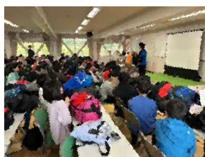
入所式の様子 3日間のスタートです。