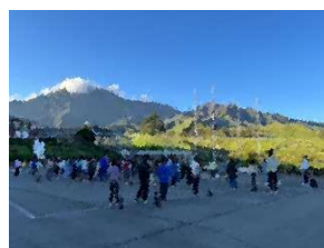
朝のつどい 阿蘇の山々がすばらしい！