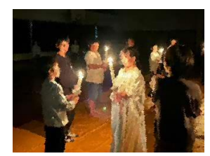
火の神が火の守に分火している様子