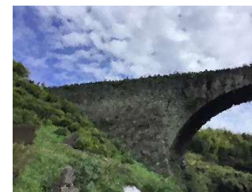
通潤橋を渡っている4年生