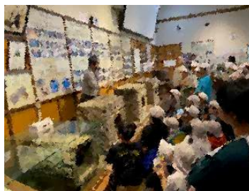
資料館での説明を聞く様子

また、清和文楽のミニ講演も観ることができました。何と「ONE PIECE」とコラボした企画もあり、子どもたちは大喜びでした。4年生は、これから学習のまとめをしていくようです。