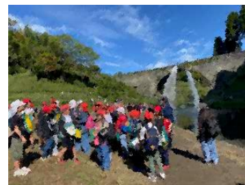
通潤橋で放水を眺める様子