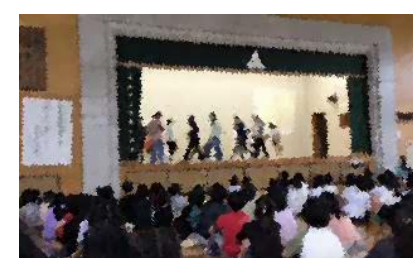
音読劇「14ひきのやまいも」