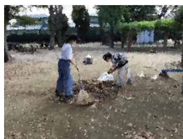
緑化委員会・・・昼休みも落ち葉拾いをしてくれました

学校を自分たちの力で創っていくと、「気づき、考え、行動している子どもたち」にエネルギーをもらっています。