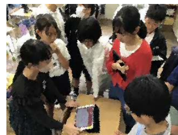
計画委員会・・・昼休みに次の児童集会の打ち合わせを

朝から2年生は、笑顔いっぱいボランティアを楽しんでいるよ。落ち葉がいっぱい集まった！