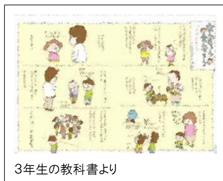
3年生の教科書より

12月7日(土)は、学習発表会が行われます。今週は、どの学年もステージ練習が本格化していました。総合的な学習の時間等で学んだことを中心に音楽をちりばめたり、劇を入れたりして工夫された構成の発表ばかりです。発表内容も、子どもたち主体で創り上げています。他学年や保護者の方々、地域の方々に知ってほしいこと、伝えたいことを考えながら発表原稿を作成しているようでした。たくさんの方々の参観をお待ちしております。また、発表会後には、学級懇談会もあります。各担任へ感想を伝えていただけるとありがたいです。