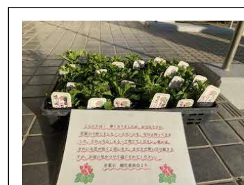
近くの独り暮らしの老人の方々へ