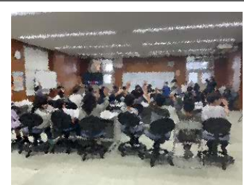
代表委員会の様子

4年生は、初めての「代表委員会」への参加でした。終わった後に、感想を聞いてみると、「緊張しました。6年生がたくさん意見を言うので、圧倒されました。」と言っていました。みんなで意見を出し合い、合意形成していく「話し合い活動の面白さ」も感じたのではないかと思います。