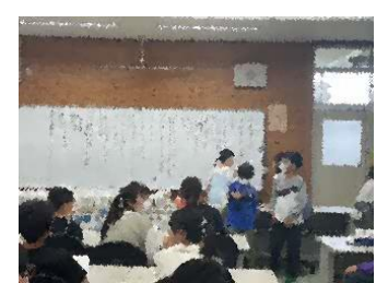
計画委員会が司会進行を！