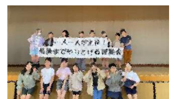
計画委員会が発表してくれました！

集会の最後の感想発表では、「運動会をがんばります。」(1年生)や「スローガンに沿った運動会にしていきたいです。」(5年生)とみんなの前で堂々と伝えてくれました。みんなの思いが込められたスローガンです。実現できるように、練習からみんなできれいでいきたいですね。