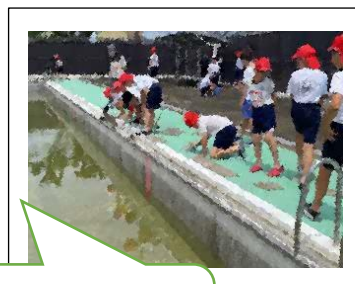
5年生はプールの外回りや倉庫をきれいにしてくれました！