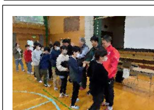
最後の握手会の様子