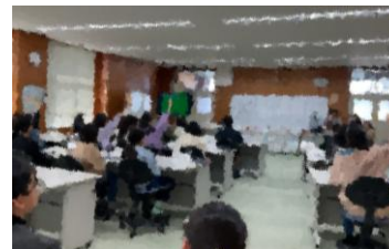
2/12の代表委員会の様子