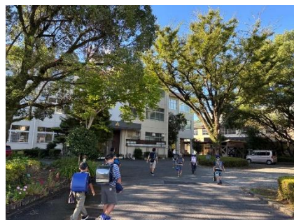
【帽子を被り元気に登校する子どもたち】

また、台風などの天候不良の際、ご家庭で登校が危険と判断された場合は、登校時間をずらしていただいて構いません。その際は、「すぐーる」にてご連絡ください。なお、荒天時に学校から毎回文書やメールを配信することはいたしません。学校全体で臨時休校・遅延登校・短縮日課などの対応を行う場合には、「すぐーる」でお知らせいたしますので、ご確認をお願いいたします。