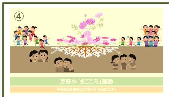
【「心のきずなを深める月間」のイメージ】

ご家庭でも「心のきずなを深める月間」について話題にさせていただきますと幸いです。その際、何かお気づきなどがありましたら、ご連絡いただければと思います。