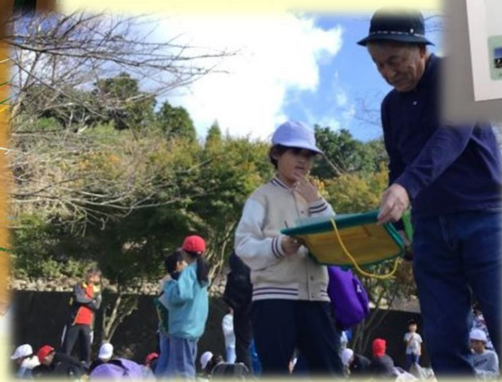
【芳野子ども俳句歳時記】