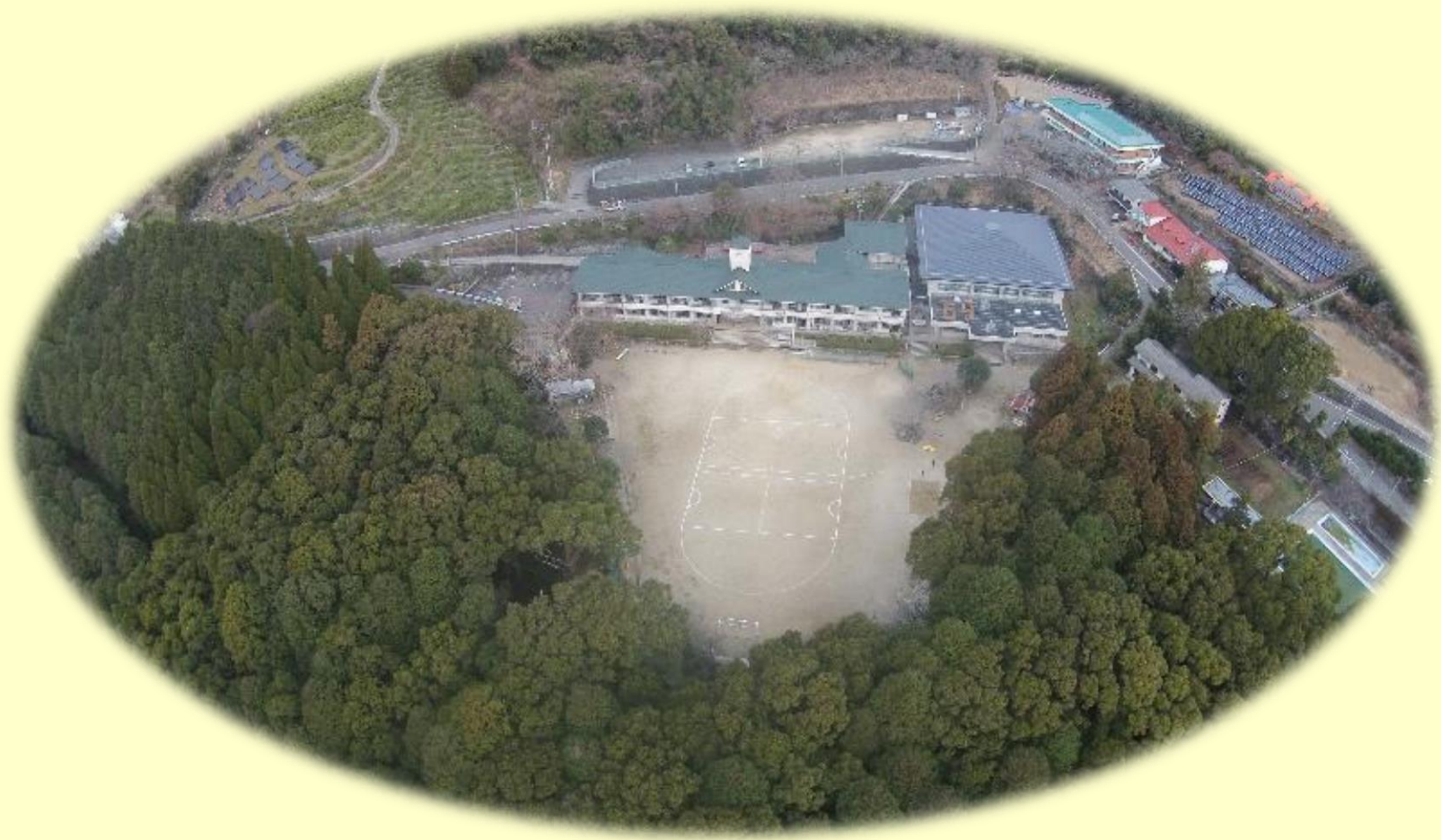
熊本市立芳野小学校