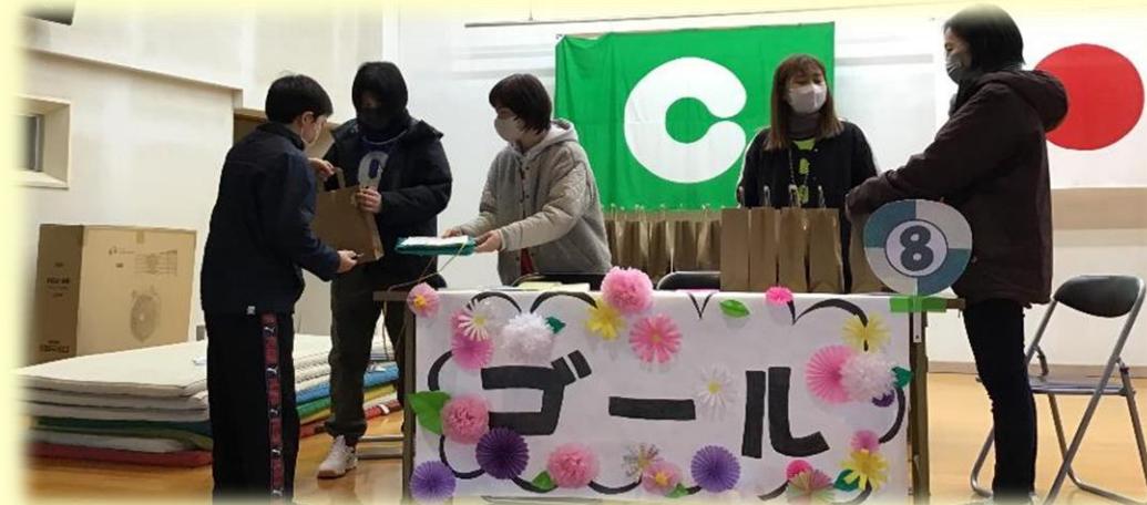
【PTA校内ウォークラリー】