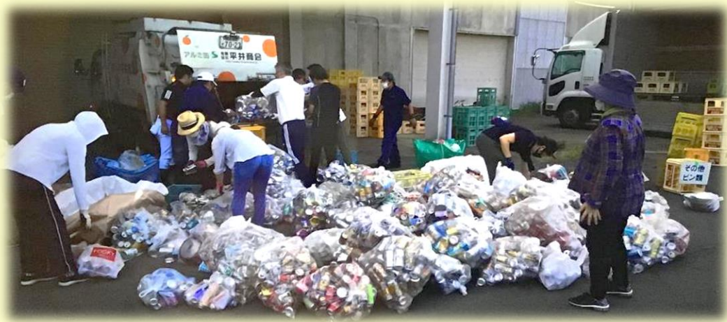
【小中PTAリサイクル回収活動】