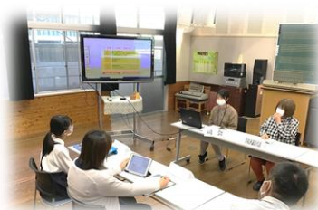
【検討委員会の様子】

本年度は、6月から準備を始めました。まず、児童会運営委員会が子どもたちへのアンケートを実施し、「学校生活のきまり」の中の“当たり前”について意見を出してもらいました。その結果、①砂場の使い方②集団登校の二つの議題について検討することになりました。そして保護者及び教職員へのアンケートを経て、10月末の検討委員会へと至りました。