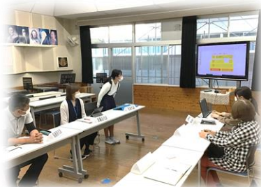
【意見を表明する児童代の6年生】

しかし、「集団下校も週1回」という意見があったからこそ、子どもたち（代表）は下校における集団の意義（共助の力の育成や異年齢交流の価値）について考え、理解できました。また、おとなの人たちが芳野小の子どもたちのことをとても大切にしていることも伝わったと思います。つまり、適切なきまりが持つ意義等を納得したうえで、集団下校に臨むようになったのです。