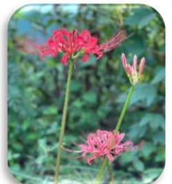
彼岸花(ひがんばな)