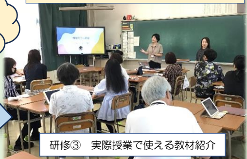
研修③ 実際授業で使える教材紹介