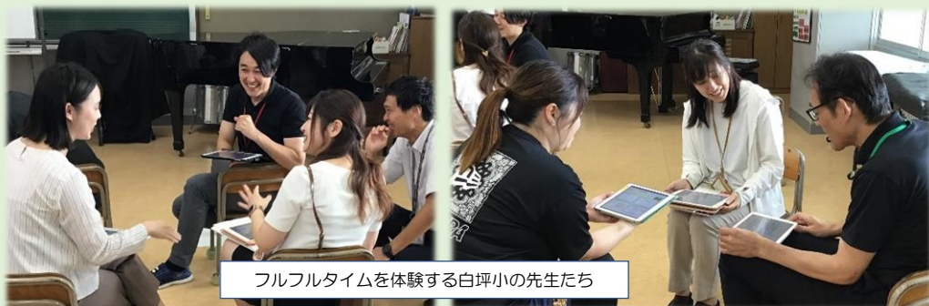
フルフルタイムを体験する白坪小の先生たち