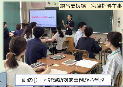
総合支援課 宮津指導主事