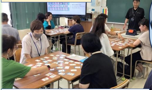
研修② かるたで学ぼう！メディアリテラシー