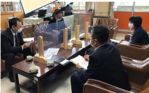
五霊中校区校長会の様子

小中一貫教育研究モデル校では、それぞれの中学校区ごとに小中校長会が開催され、今年度の小中一貫教育推進についての方針が話し合われました。