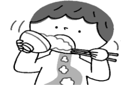
食べる時、かむ回数が 少ない(30回以下)