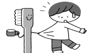
食べた後に、歯みがきを しないことがある