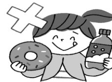
おやつや清涼飲料水が 大好きでよくとる

大人になってもいい歯を維持するために、以下の一つでもあてはまる人は要注意です。 食後の歯みがきや歯医者さんでの歯科検診など、歯のケアを心がけてください。