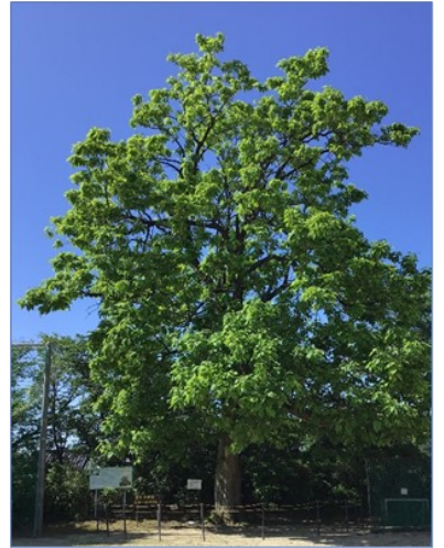
シンボルツリー「カタルパ」