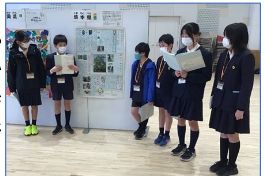
全国フェスティバルでの発表

全国フェスティバルの概要は、右のQRコードから、「こどもエコクラブ」のページに入り、ご確認いただけます。