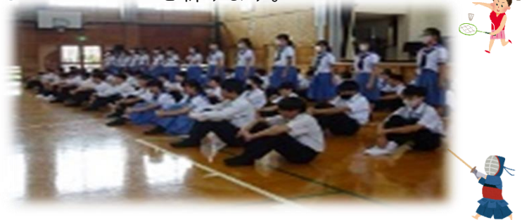
6月17日に行われた中体連選手激励会の様子

6月21日(金)のサッカー部の試合を皮切りに、熊本市の中体連大会が始まります。これまでの練習で身に付けた技能、体力、精神力、チームワークで、精一杯のパフォーマンスを見せてくれることと思います。選手の皆さんの健闘を祈ります。