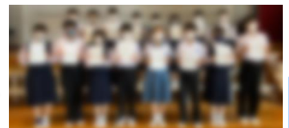
生徒会執行部・委員長の皆さん