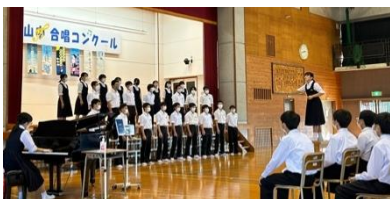
3年1組自由曲「友～旅立ちの時～」