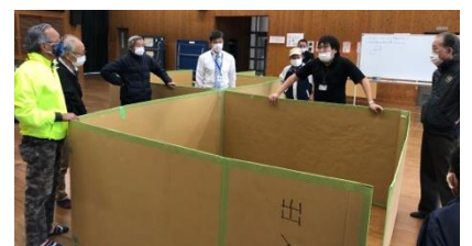
避難所でのパーティションの組み立て