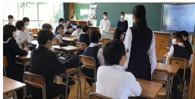
体育委員会の様子

本校では生徒全員が委員会に所属しますが、4月19日(火)に、今年度1回目の常任委員会が行われました。自己紹介、年間行事や常時活動の確認、役割分担など生徒が主体となって活動していました。