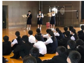
部活動紹介(吹奏楽部)

4月15日(金)に生徒会が主催して新入生歓迎会を行いました。体育館で部活動紹介があり、その後は各教室でオンラインによるクイズ大会があり、楽しい歓迎会となりました。