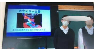
図書委員会の紹介

4月14日(木)に委員会紹介をオンラインで行いました。各委員会がプレゼンを作り、わかりやすい紹介をしてくれました。