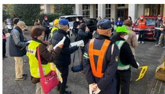
ボランティアの保護者や地域の皆さん

ご協力いただいた保護者の皆様、地域の皆様、本当にありがとうございました。この桜山中ウォークラリーは、保護者や地域の皆様のご協力なくでは実施できない行事です。桜山中PTA・校区の方々のチームワークの素晴らしさを改めて実感しました。心より感謝申し上げます。