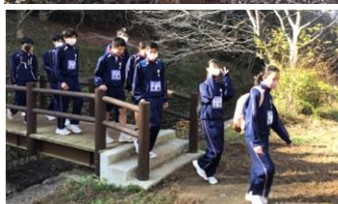
朝の立田山は寒くもなく爽やかでした