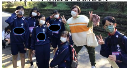
グレイ先生も1年生と一緒に歩きました