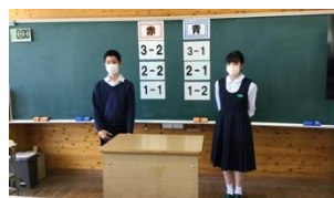
団決めの様子(結団式)