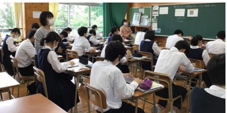
課題に集中する3年生(数学)