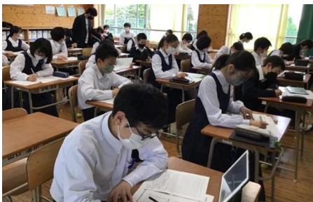
進路学習に取り組む2年生(学活)