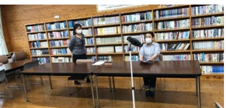
オンラインによるPTA総会