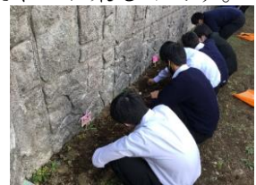
チューリップの球根を植える3年生

昨日12月15日(水)の常任委員会の時に、整美委員の皆さんが東門の下の花壇に植えました。中央区まちづくりセンターからも見に来られました。春に花が咲くのが楽しみです。