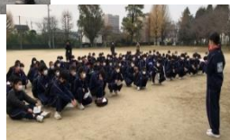
生徒会副会長から諸注意(出発式)