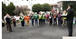
ボランティアの保護者や地域の皆さん

生徒の皆さんにとって、思い出に残る行事の一つとなったことでしょう。ご協力いただいた保護者の皆様大変お世話になりました。