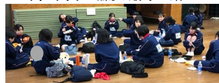
みんなで弁当を食べる楽しいひととき