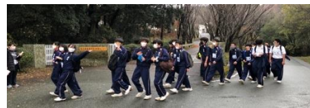
ウォークラリーで深まったクラスの絆