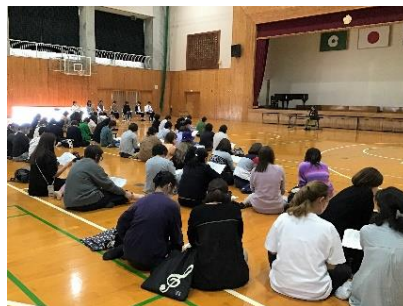
体育館で協議している様子

育友会総会は3年ぶりに対面での実施になりました。計画案や予算案の承認、新役員の紹介、学校職員の紹介等がありました。ご参加いただきました保護者の皆様ありがとうございました。