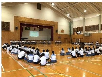
お互いの顔が見える生徒総会の様子

中スマホールール、いじめ撲滅宣言などを全校生徒が参加して話し合いました。3年ぶりに対面での生徒総会ができ、本当によかったと思いました。