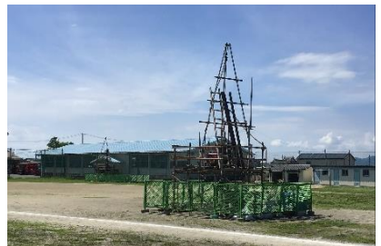
運動場中央に設置された機械の様子

5月22日から天明中学校の地質調査(ボーリング調査)が始まりました。令和9年4月開校予定の義務教育学校の校舎建設工事に向けて、校内7か所の地質調査が行われています。現在は、7か所目の運動場中央の調査が行われていて、6月末まで調査が続く予定です。