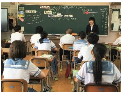
教育実習生による英語の授業

6月2日(金)には教育実習生による研究授業があり、3年英語「現在完了形」の授業では、熊本の有名な場所や食べ物を英語で表現することから始まり、ペアでの活動もあり、終始楽しい雰囲気の中で学ぶことができました。