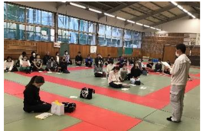
武道場で打合せをしている様子

5月10日(水)の夕方に育友会合同委員会がありました。育友会長の挨拶後に今後の活動について部会ごとに話し合いがありました。