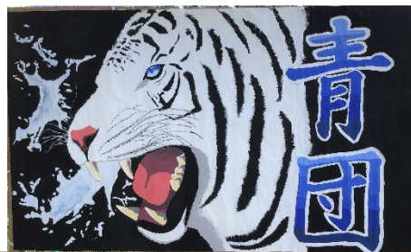
各団のパネル（パネル係が放課後等を利用して心を込めて描いた絵）

中スマホールール、いじめ撲滅宣言などを全校生徒が参加して話し合いました。3年ぶりに対面での生徒総会ができ、本当によかったと思いました。