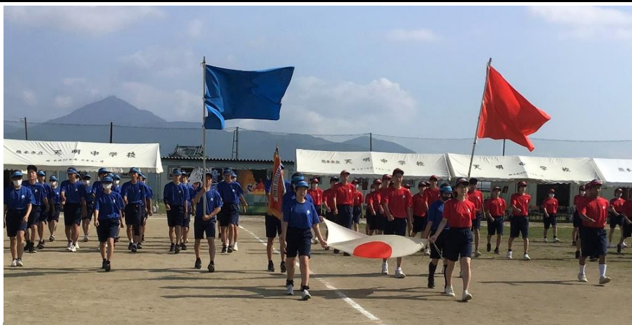
第67回天明中学校体育大会開会時の入場の様子

6月2日（金）に生徒総会がありました。今年度の生徒会の方針や委員会の活動計画、天明