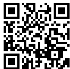
(天明中 HP の QR コード)