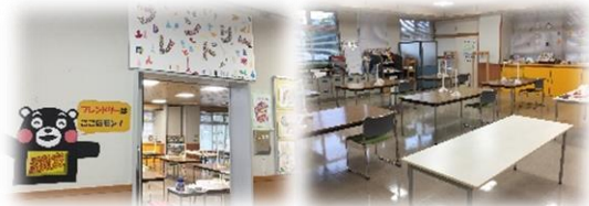
フレンドリー室内の様子