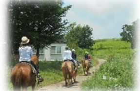
所外体験活動 乗馬体験