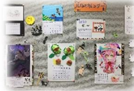
ものづくり活動作品