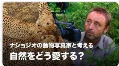
ナショナルジオの動物写真家と考える 自然をどう愛する?

今月は、ナショナルジオグラフィックの動物写真家、フランス・ランディングさんの生き方・考え方を通してセッションを行いました。このセッションでは、「自然とのつながりを感じた瞬間を思い出す」のテーマに対して、①その自然はどんな姿をしていましたか? ②あなたは何を感じましたか? という二つの問いに自分自身でアウトプット(回答)した後、他の人のアウトプットに対してフィードバックを行いました。